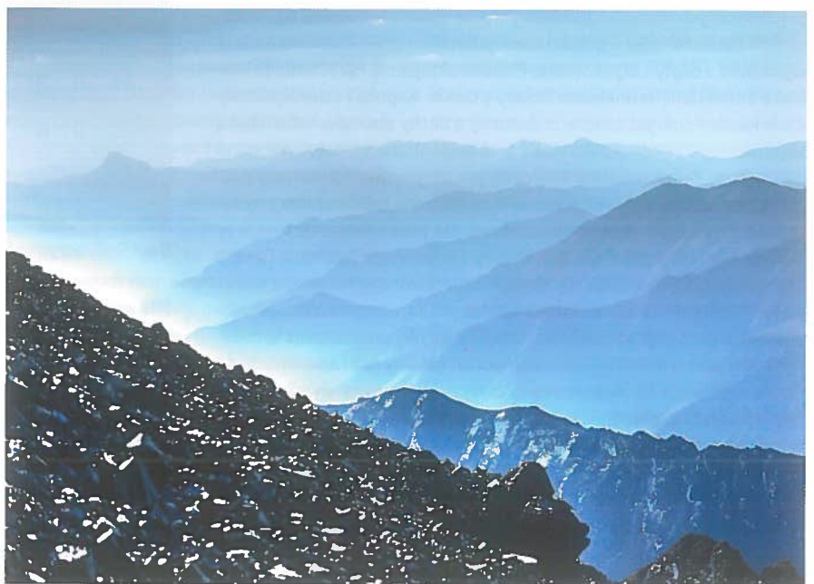
Alam Kuh o wysokości 4850 m n.p.m. (szczyt w górach Iranu) – zdjęcie ukazuje widok na góry Elburs, z górującą nad innymi Azad Kuh i kryjącą się za nią piramidą ponadpięciotysięcznego Damavendu (z lewej strony panoramy).